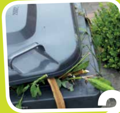
2 Help, er komen wormpjes uit de gft-container