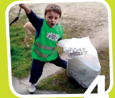
4 In actie tegen zwerfvuil