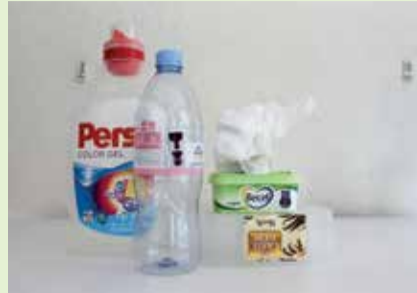
Antwoord A. Alleen doorzichtige of groene plastics

Welke plastics mogen er in de blauwe pmd-zak (naast de metalen verpakkingen ("m") en de drankkartons ("d"))?