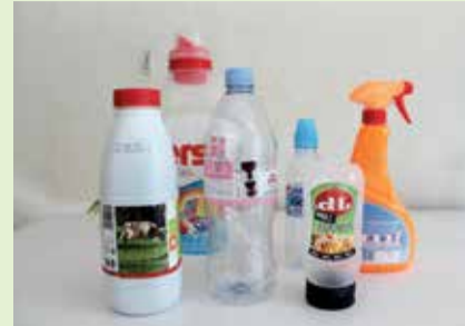
Antwoord B Alleen plastic flessen (bv drank, wasmiddel, shampoo)