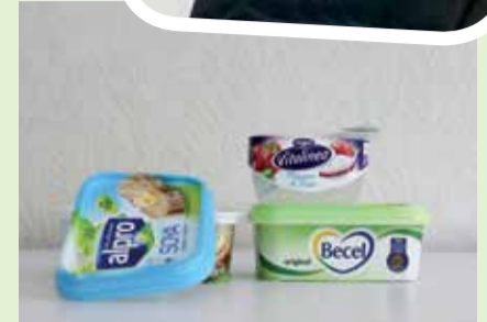
Antwoord C Alleen yoghurtpotjes en margarinevlotjes